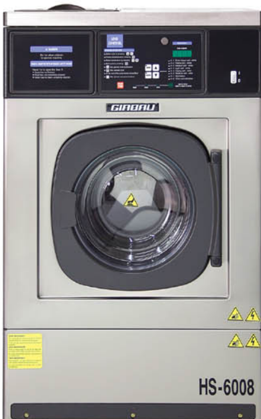
HS-6008 Capacité 8 kg