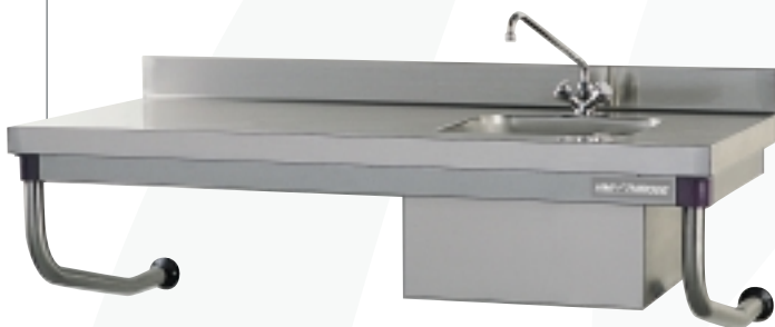
TABLE DU CHEF SUSPENDUE